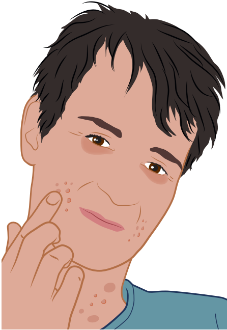
bultjes op de huid